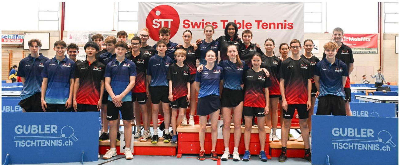
Swiss Table Tennis cadre de la relève 2024